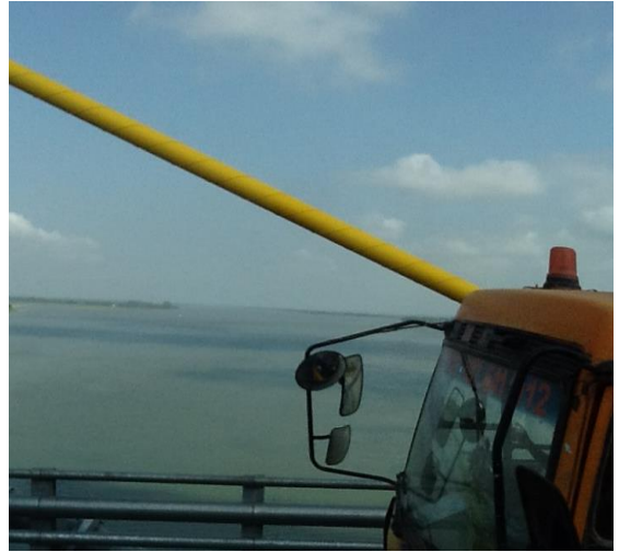
(Hand rail of bridge/tourist bus are shown and Mekong River is in the background)