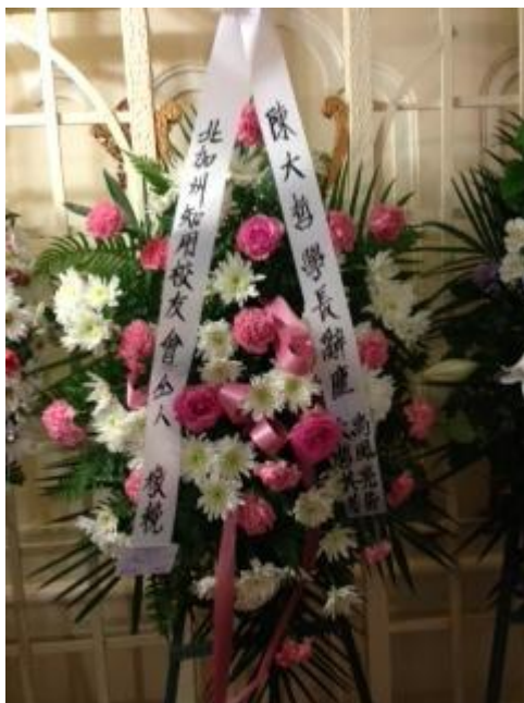
北加州校友會花圈致輓